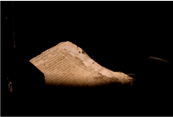
3. Seydou Camara, Les Manuscrits de Tombouctou (2009) 30x45 cm