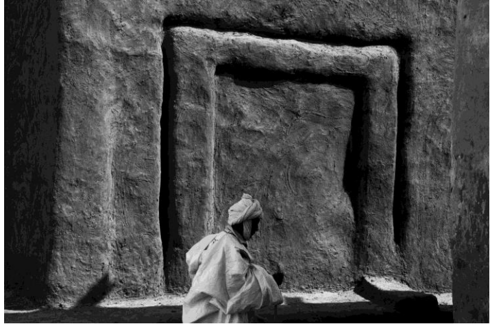
2. Ferrante Ferranti, Oulata , 2014, 40x50 cm