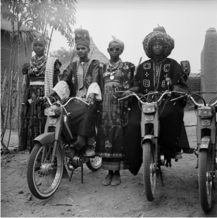
1. Mory Bamba, Les Peuls de ma région de Sikasso , 2010, 40x40 cm