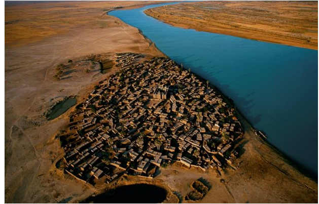
4. Yann Arthus-Bertrand Village sur la rive du fleuve Niger, région de Mopti, Mali (14°27' N - 4°16' O), 1997, 42x59,4 cm