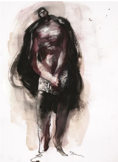
5. Paul Bloas, Billet d'Afrique, Madagascar , 2001- Gouache sur papier, 20x30 cm